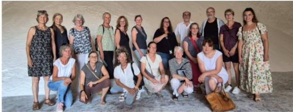
Mitarbeiterinnen und Mitarbeiter der Spitex Wintersingen, inkl. Vorstand

Die Spitex Wintersingen ist ein kleiner Betrieb, könnte man meinen. Um einen reibungslosen Ablauf für unsere KlientInnen zu gewährleisten, sind wir bei der Spitex Wintersingen aber genauso sehr auf eine einwandfreie Koordination, auf gut eingespielte Abläufe sowie auf verlässliches Personal angewiesen. Als eine der kleinsten Spitex-Organisationen im Baselbiet sind wir stolz auf unsere Eigenständigkeit und auf das persönliche Engagement unserer MitarbeiterInnen in der Pflege, in der Hauswirtschaft, im Mahlzeitendienst und in der Aktivierung.