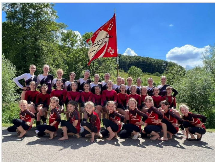
GeTu und Damenriege Wintersingen an der KMVW Ormalingen

Am Sonntag, 29. Mai 2022 fand die kantonale Meisterschaft im Vereinswettkampf (KMVW) in Ormalingen statt. Bei idealem Wetter und einer unglaublichen Stimmung starteten die GeTu Mädchen kurz vor 11Uhr. Leider schlichen sich kleine Fehler in die Übung ein, was den Sieg kostete. Da aber nur drei Teams in der Jugendkategorie Schulstufenbarren starteten, landeten die jungen Turnerinnen auf dem zweiten und dritten Podestplatz, hinter der Mädchenriege Buus.