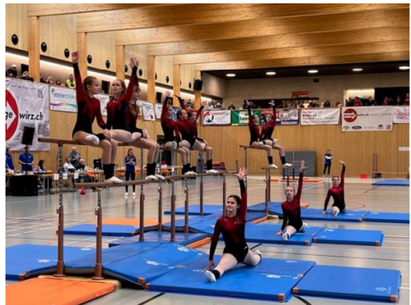
Die Jugend des TV Wintersingen zeigt in Magden in der Halle Matte stolz ihre Vorführung am Schulstufenbarren

Am Samstag trat die Jugend an. Dem staunenden Publikum wurden 67 kreative Vorführungen in neun verschiedenen Kategorien präsentiert. Am folgenden Sonntag durften auch die aktiven Turner:innen ihr Können zeigen und die Zuschauer:innen kamen in den Genuss von 75 abwechslungsreichen Vorführungen. Die teilnehmenden Vereine reisten aus den Kantonen Baselland, Aargau, Basel, Solothurn und Bern an.